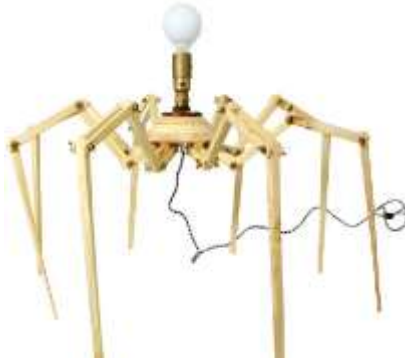
شكل (8) (أ)(ب)(ج) تمثل نماذج وتصاميم متنوعة لإضاءة محاكي تصميماتها من الخلية العصبية [25]