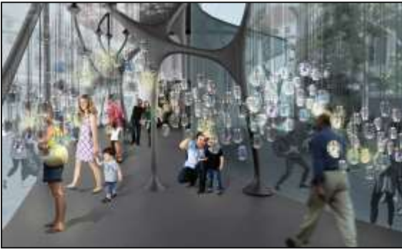
شكل (18) (أ) (ب) بعض التصميمات المحاكاة من الخلايا العصبية