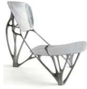
شكل (10) [24]

شكل (10) في عام 2007، قام جوريس لارمان "Joris Larman" من أمستردام، بتصميم هيكل كرسي يحاكي العظام مصنوع من خلايا متخصصة وألياف البروتين قوية ولامعة كالمعدن بحيث يتفاعل الهيكل المصمم لمقاومة الضغوط المستمرة خارجيا. [15]