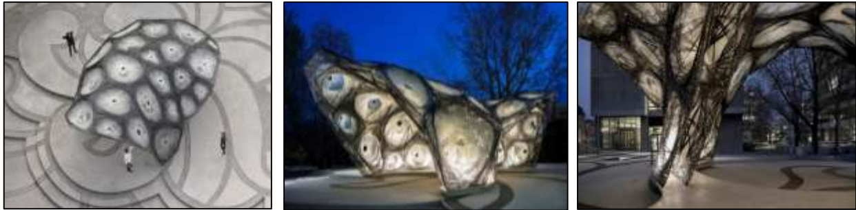
(أ) (ب) (ج)

شكل (15) (أ) (ب) بعض التصميمات كتغطيات خارجية في الأماكن العامة مستوحاة من الأشجار [20] [26]