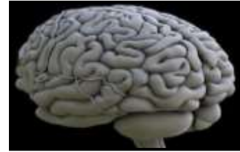
شكل (1) المخ البشري تحليل المخ البشري

شكل (3) تحويل الشكل إلى مسارات حركة تحقق الفكر التصميمي للمتاهة على المستوى الأفقي.