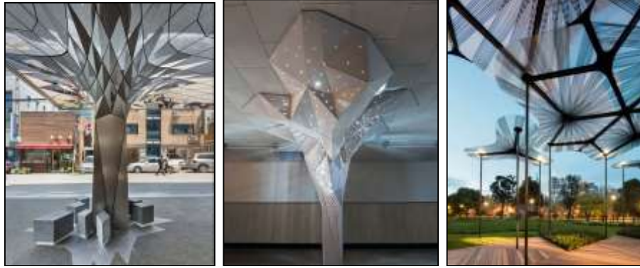
(أ) (ب) (ج) تطبيقات متنوعة مستوحاة من تصميم النخل والأشجار [15] [16] [21]

شكل (14) (أ) (ب) (ج) تطبيقات متنوعة مستوحاة من تصميم النخل والأشجار [15] [16] [21]