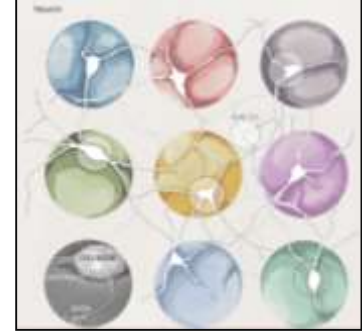
شكل (17) تشكيل الخلايا العصبية