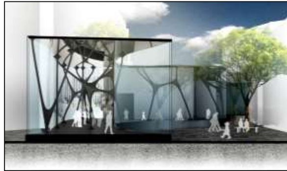
شكل (19) توظيف الهياكل المصممة بداخل الفراغ بشكل وظيفي وجمالي شكل (20) التصميم داخليا من خلال الهياكل موضعا ترابط التصميم داخليا وخارجيا حيث الشفافية وارتباطه بالبيئة الخارجية